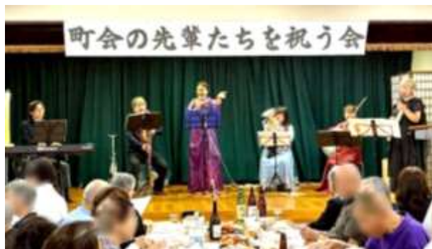
町会での活動の様子

私たちは、演奏を聴くだけのコンサートではなく、皆さんにも体験していただき、音楽の楽しさを知っていただくことにこだわっています。年齢や、障害の有無など全く関係なく、「誰もが音楽を楽しめる環境作り」を私たちのモットーとして、これからも戸田市を音楽で盛り上げ、地域のみなさんがより元気になっていただけるよう活動していきます！