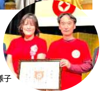
戸田市表彰式の様子