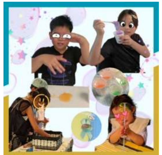
企画したイベントの様子

老いや幼さは弱さでしょうか？老人には智慧、子どもにあるのが活力。それは現役世代が忘れがちなものです。組合せ次第で、弱者と言われる人が負い目を感じる事なく暮らせる地域になれるはず。そんな組合せに出会うたび、地域が変わっていくのを感じています。