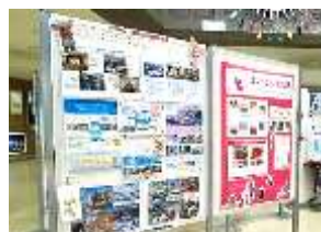
展示の様子(昨年度)