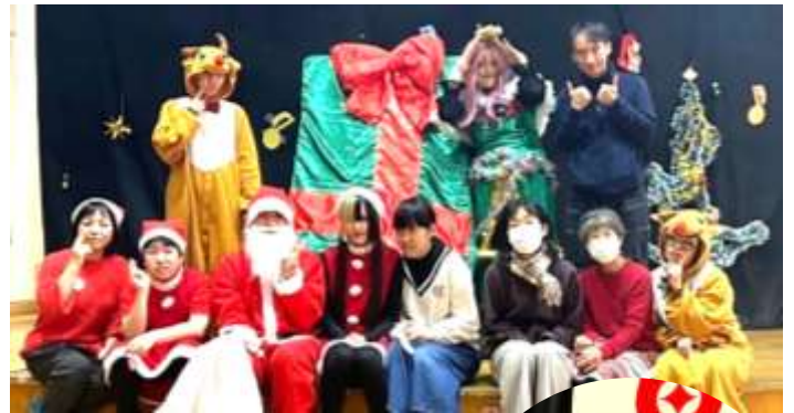
クリスマス会で集まった メンバーとボランティア の皆さん