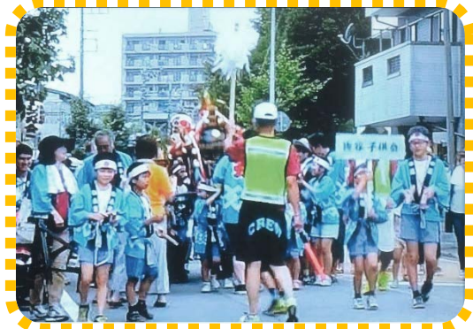
上戸田氷川神社夏祭りに子供神輿をだして参加