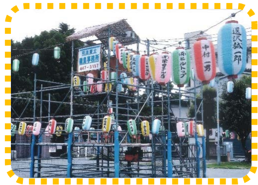
盆踊り大会の櫓建