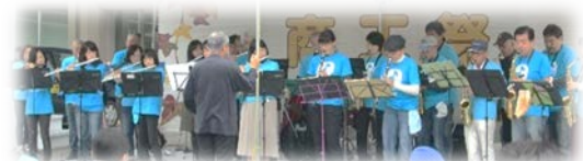
オトなバンド戸田倶楽部 吹奏楽演奏