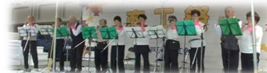
さくら草ハーモニカ愛好会の演奏