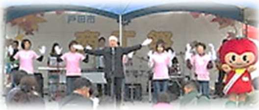
トマピー応援団&セブンストーンズの 応援団&バンド演奏&ダンス