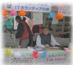
NPO法人戸田ITボランティアの会 の写真入りカレンダー作成