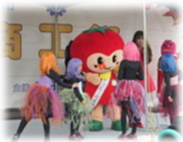
TODAこどもパラダイス！ &トマピーのコラボダンス♪