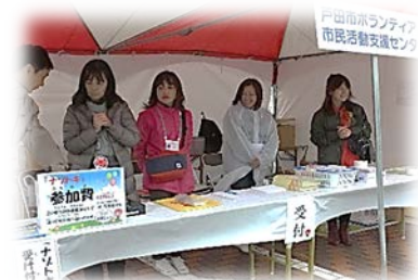
本部・クイズラリー「ナソトキ」 災害義援金のご協力 ありがとうございました！