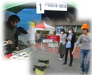
戸田遊び場・遊ぼう会 ベーゴマ色付け・回し体験

参加団体の皆様お疲れさまでした。会場準備・整理等のご協力ありがとうございました。